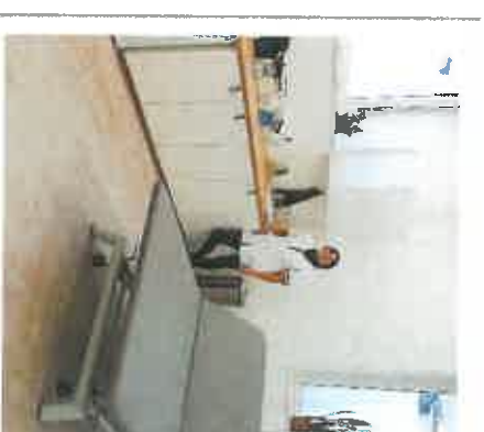
CABINET D'EXAMEN ADAPTE